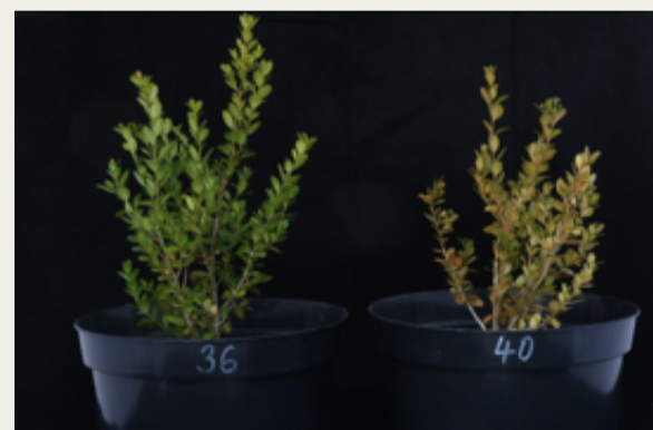
S Hydrokompostem po 36) 50 dnech sucha 40) 67 dnech sucha

Hydrokompost oddaluje a zmírňuje nástup sucha a nedostatek vody v půdním profilu. Organická hmota v Hydrokompostu zadržuje větší množství vody a prodlužuje dobu, kdy vegetace není vystavena stresu.