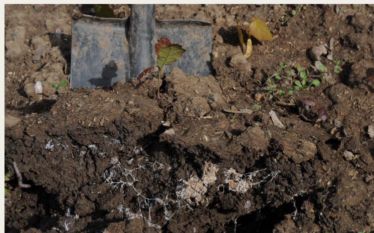
Patrný růst mycelií zejména v okolí Hydrokompostu

Sázení dubů z žaludů na kontrolním záhonu - porovnání variant s Hydrokompostem , lignohumátem a symbiotickými houbami Celkem 5 variant.